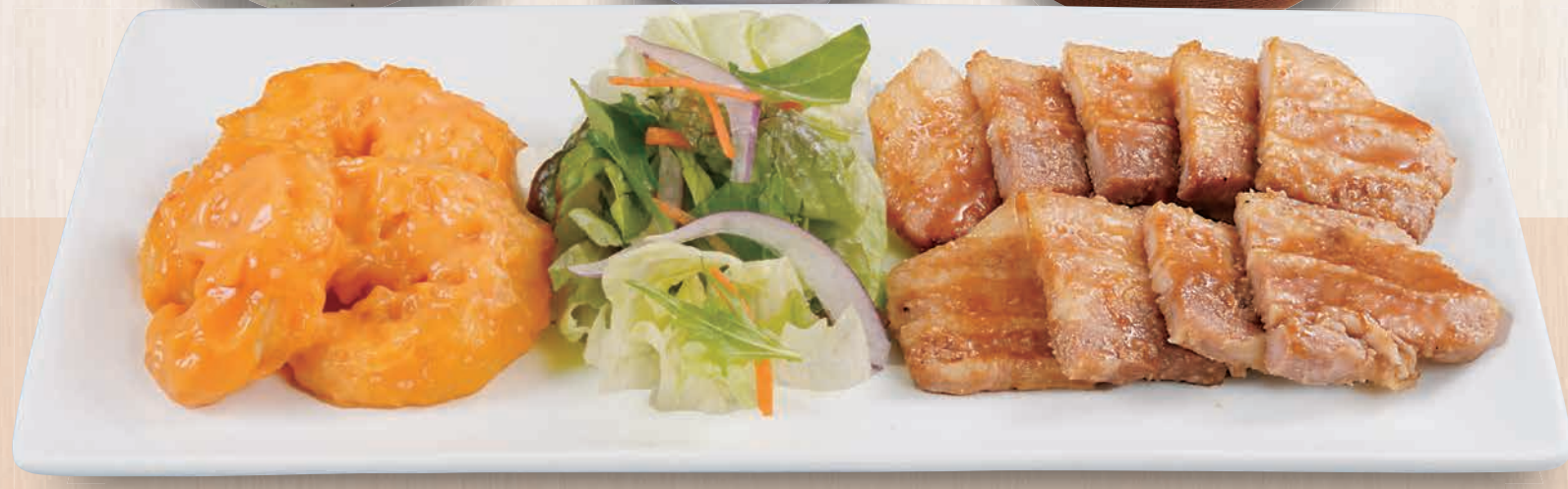
海老マヨとしょうが焼き定食 1,280(税込1,408) プリプリの海老マヨとしょうが焼き。人気コンビを一緒にどうぞ。 海老マヨとしょうが焼き単品 1,080(税込1,188) 定食 1050kcal 食塩分 5.4g 単品 688kcal 品塩分 2.9g