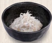
しらすおろし 200(税込220) 14kcal 塩分0.2g