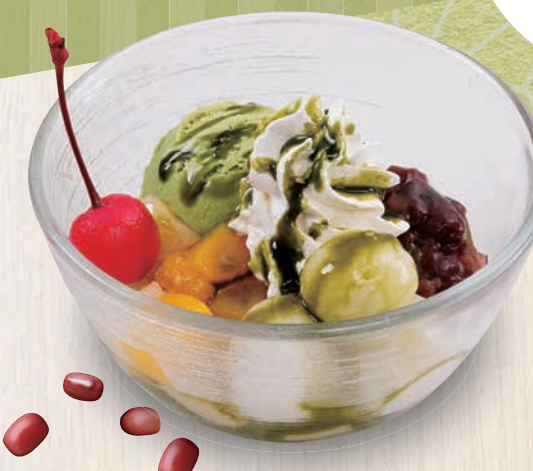
白玉抹茶あんみつ 580(税込638)

抹茶ゼリーと、抹茶アイス、白玉団子に、 ゆで小豆をトッピング。 抹茶ソースでお召し上がりください。