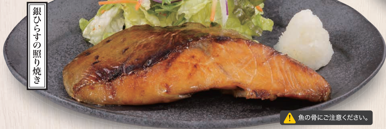
銀ひらすの照り焼き