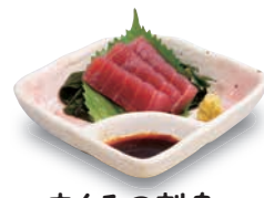
まぐろの刺身 460(税込506) 42kcal 塩分1.8g