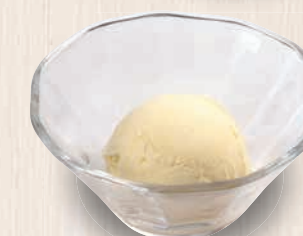
バニラアイス 220(税込242)