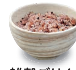
雑穀ごはん 220(税込242) 302kcal 塩分0.0g