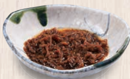
もずく酢 180(税込198) 11kcal 塩分1.0g