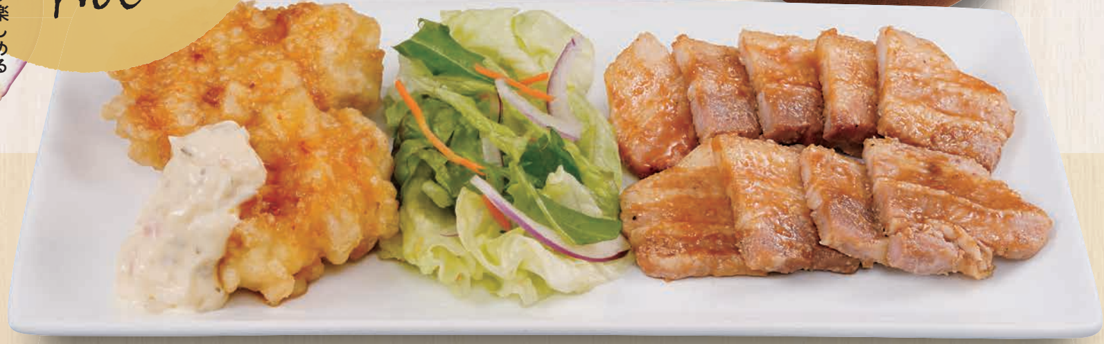
チキン南蛮としょうが焼き定食 1,280(税込1,408) チキン南蛮にしょうが焼き1人前を組み合わせた、ごはんがすすむメニューです。 チキン南蛮としょうが焼き単品 1,080(税込1,188) 定食 1215kcal 食塩分 6.0g 単品 853kcal 品塩分 3.4g

コンビ menu ふたつの人気メニューが楽しめる 食べごたえ十分の満足メニューです。