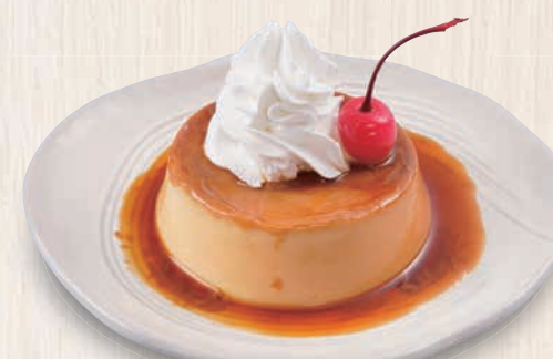
カスタードプリン 480(税込528)