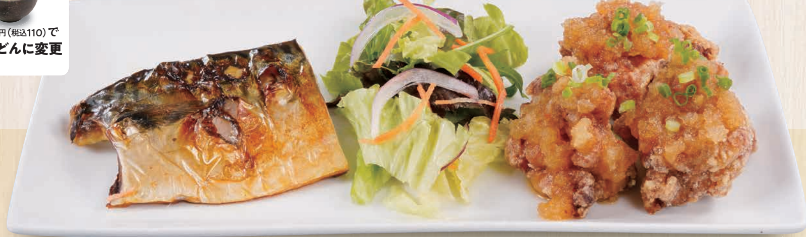
焼き魚とから揚げみぞれ酢定食 1,180(税込1,298) パリッと仕上げた焼き魚と、サッパリみぞれ酢のから揚げのセット。 焼き魚とから揚げみぞれ酢単品 980(税込1,078) 定食 906kcal 食塩分 6.1g 単品 544kcal 品塩分 3.6g