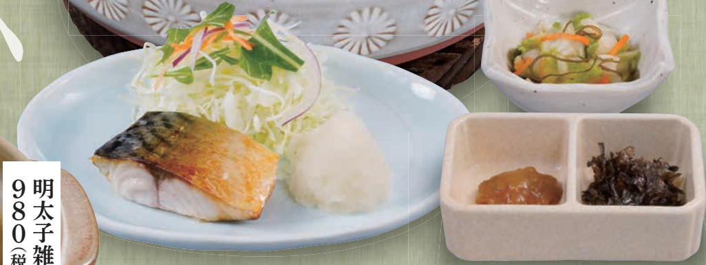
もずくの健康雑炊定食 (塩さば付)

980(税込1,078) 定食: 485kcal 塩分4.7g 単品: 350kcal 塩分3.9g