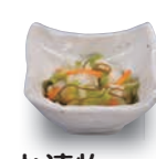
お漬物 60(税込66) 8kcal 塩分0.6g