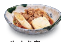
牛すき煮 460(税込506) 147kcal 塩分0.9g