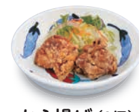
から揚げ(2個) 360(税込396) 172kcal 塩分1.1g