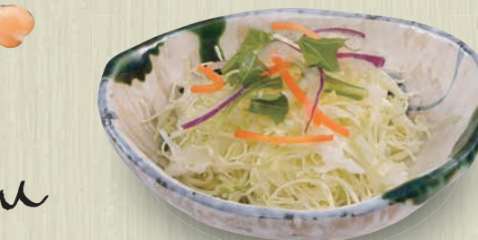
ちょっとサラダ 150(税込165) 14kcal 塩分0.2g