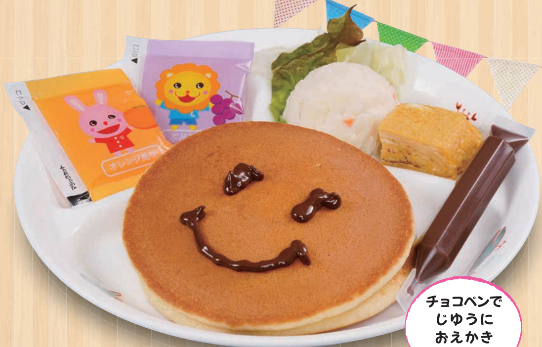
おこさまお絵かき パンケーキ 680(税込748)