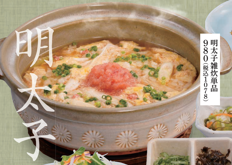
明太子雑炊単品 980(税込1,078)