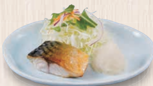
塩サバ 280(税込308) 127kcal 塩分0.3g