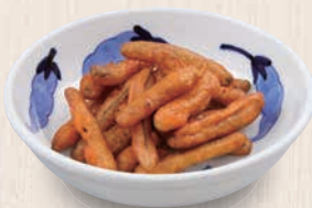
ごぼうから揚げ 480(税込528) 223kcal 塩分1.0g