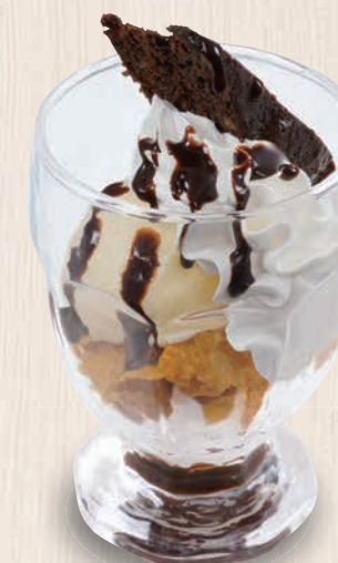
ブラウニーパフェ 420(税込462)