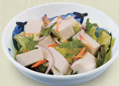
豆腐サラダ 380(税込418) 高タンパクでヘルシーなお豆腐のサラダ。 165kcal 塩分0.5g