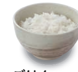
ごはん 220(税込242) 302kcal 塩分0.0g