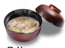
貝汁 330(税込363) 131kcal 塩分2.7g