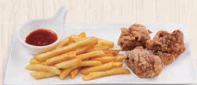
ポテトフライとから揚げ 630(税込693) 265kcal 塩分1.4g