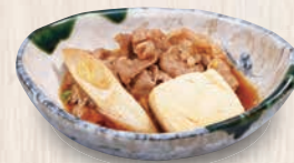
牛すき煮 460(税込506) 147kcal 塩分0.9g