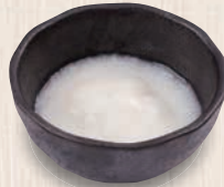
とろろ 180(税込198) 23kcal 塩分0.0g