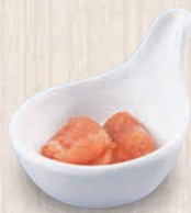
明太子 200(税込220) 26kcal 塩分0.8g