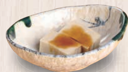
ごま豆腐 180(税込198) 57kcal 塩分0.6g