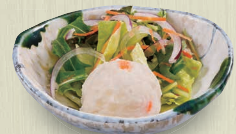
ポテトサラダ 250(税込275) 129kcal 塩分0.8g