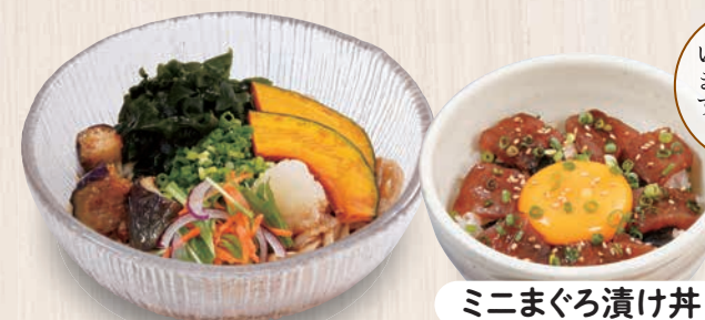
ミニまぐろ漬け丼