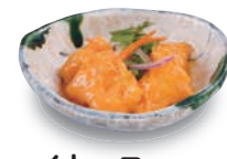
イカマヨ 360(税込396) 187kcal 塩分1.1g