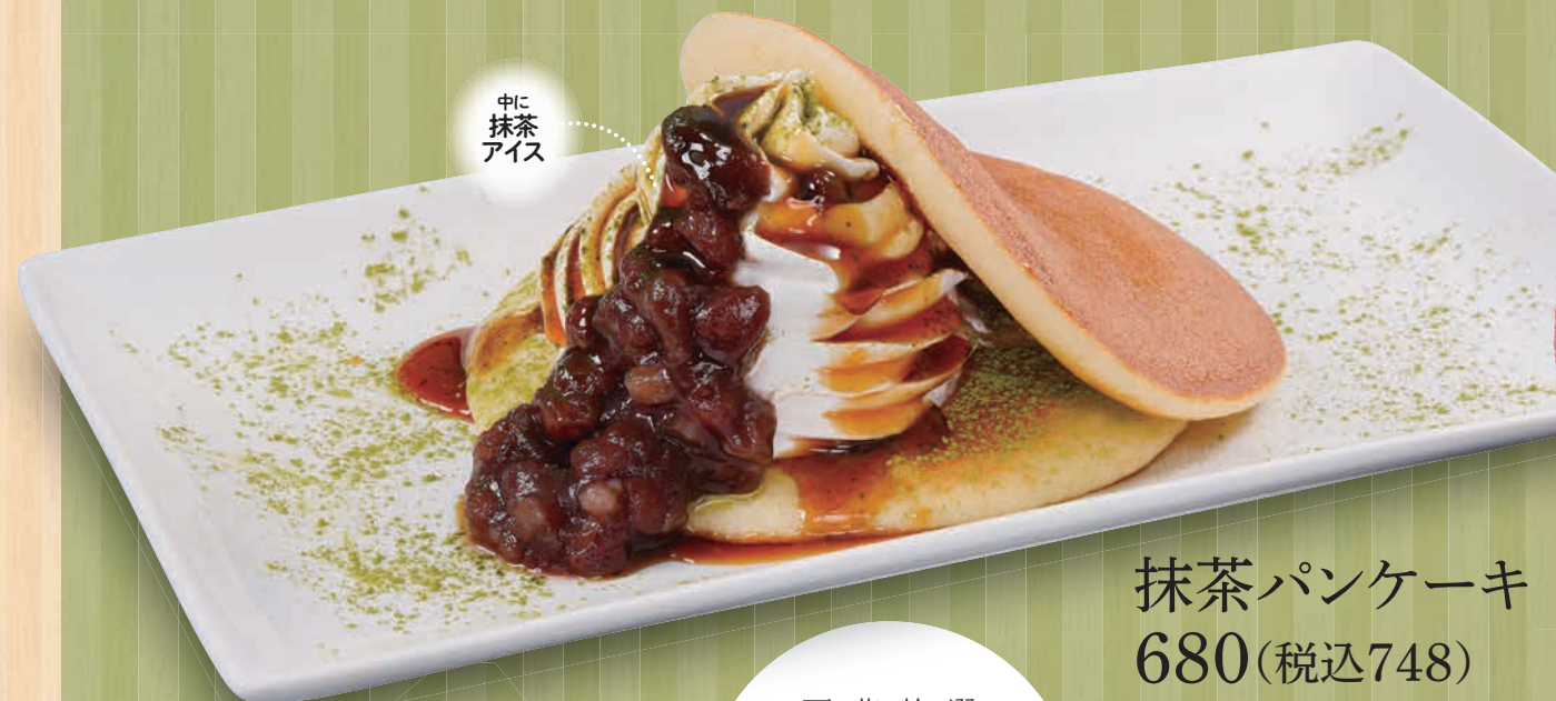
抹茶パンケーキ 680(税込748)

宇治抹茶、黒蜜、小豆で大胆に和のアレンジ。 ホイップの下には宇治抹茶アイス。 抹茶アイス 220(税込242)