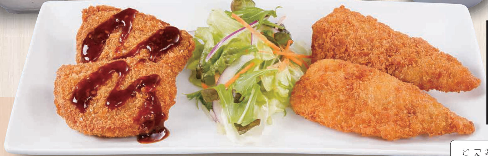
ヒレカツとアジフライ定食 1,180(税込1,298) サクサク衣の肉厚ヒレカツと人気の松浦アジフライです。 ヒレカツとアジフライ単品 980(税込1,078) 定食 1005kcal 食塩分 4.7g 単品 644kcal 品塩分 2.2g