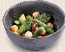
ビーンズサラダ 160(税込176) 37kcal 塩分0.3g