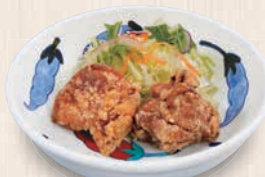
から揚げ (2個)360(税込396) (5個)630(税込693) (2個) 172kcal 塩分1.1g (5個) 415kcal 塩分2.6g