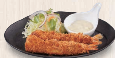
エビフライ 630(税込693) 294kcal 塩分1.1g

●カロリー・塩分表記は日本食品標準成分表による計算値(一人前・概算)です。 ●アレルギー情報はホームページでご覧いただけますのでご参照ください。