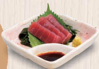
まぐろの刺身 460(税込506) 42kcal 塩分1.8g