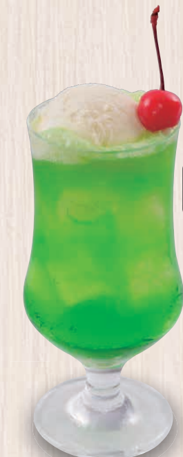
クリームソーダ 380(税込418)