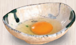
生卵 100(税込110) 78kcal 塩分0.2g