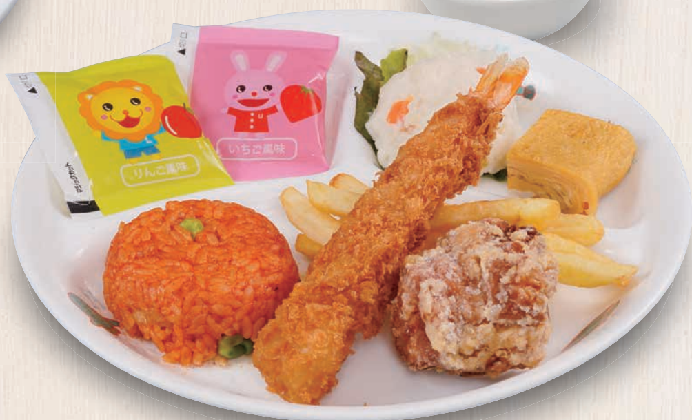
おこさまランチ 700(税込770)

※卵、乳、小麦、そば、落花生、えび、かに、くるみの8種類の原材料は使用しておりません。 ※添加物としての調味料、着色料は使用しておりません。 ※店内では8大アレルギーを含むその他商品の調理・盛り付けを行っています。 ※キッチン内の通常の調理機器・器具を使って調理しています。 ※アレルギー症状の重篤な方・敏感な方はご注意ください。 ※アレルギー症状が発生しないことをお約束するメニューではありません。