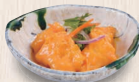
イカマヨ 360(税込396) 187kcal 塩分1.1g