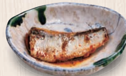
鰯の梅煮 430(税込473) 122kcal 塩分0.6g