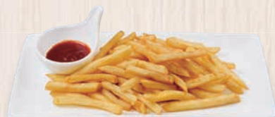
大盛りポテトフライ 480(税込528) 437kcal 塩分1.4g