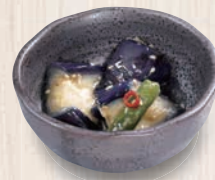
揚げ茄子とインゲンの 生姜あん 160(税込176) 26kcal 塩分0.4g