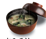
おみそ汁 200(税込220) 51kcal 塩分1.9g