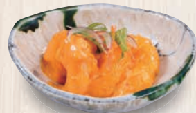
海老マヨ 360(税込396) 163kcal 塩分1.1g