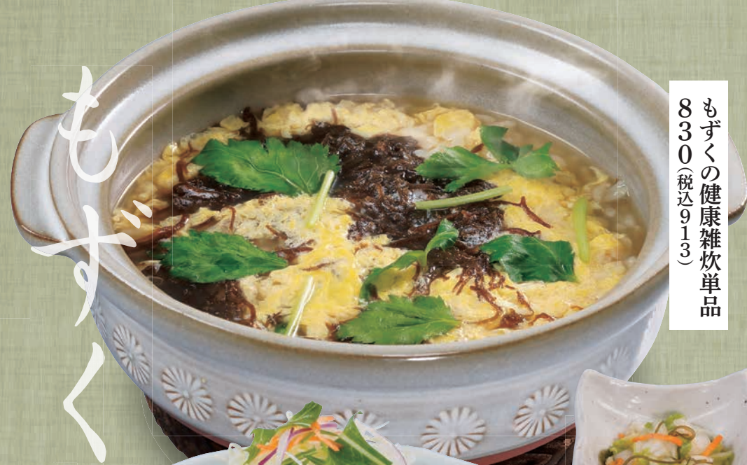
もずくの健康雑炊単品 830(税込913)