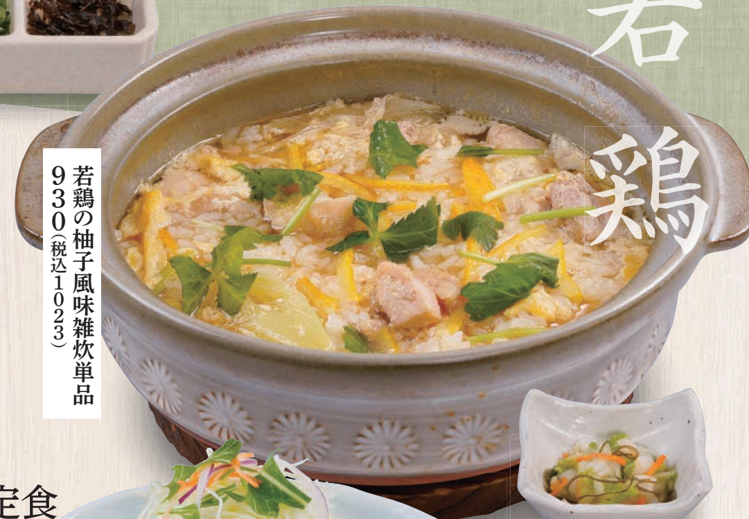
若鶏の柚子風味雑炊単品 930(税込1,023)