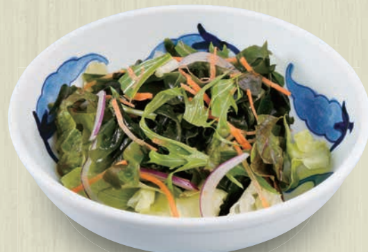
わかめサラダ 380(税込418) 低カロリーで栄養豊富なわかめがたっぷり。 100kcal 塩分1.0g